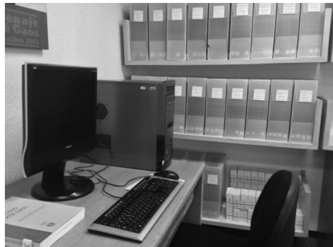
Área de Archivos

A partir de 1997 se han recibido diversos documentos, a los que independientemente de su procedencia se les ha concentrado en la Serie CUATRO , que se forma de 13 carpetas. También, en el año 2000 la Biblioteca Nacional de México fumigó las cuatro series. En 2006 en el Fondo Gaos se realizó la conversión de la base Gaos en ISIS al programa Aleph.