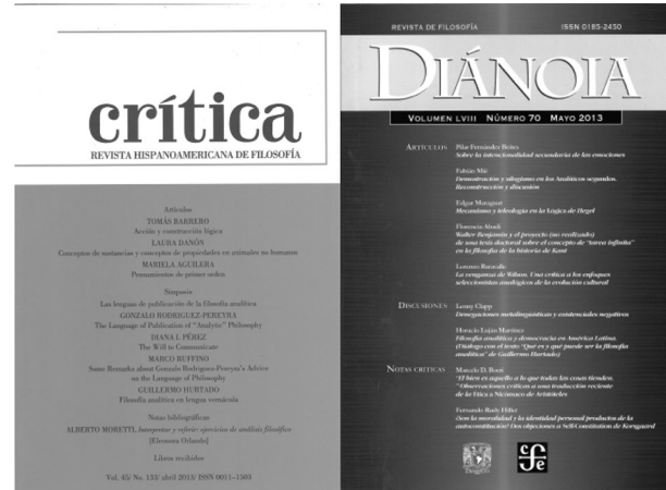
Revistas del Instituto de Investigaciones Filosóficas

Sobre el particular es oportuno destacar que el acervo se ha visto enriquecido con las donaciones de libros y archivos de figuras prominentes de la Filosofía como José Gaos, Alfonso Reyes, Eduardo García Máynez, Samuel Ramos y Alejandro Rossi. 5