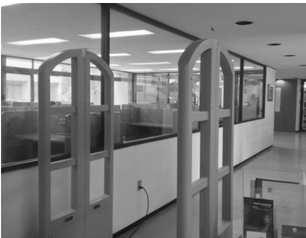
Entrada de la Biblioteca Eduardo García Máynez

El organigrama de la Biblioteca comprende una Coordinación y cuatro secciones: Desarrollo de Colecciones y de Cómputo, Colecciones Especiales, Hemeroteca y Bibliografía Filosófica Mexicana y Archivos.